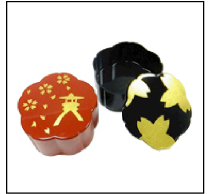
ミニ桜小箱 樹脂製・ 8.5×8.5×4.2cm 2,100円