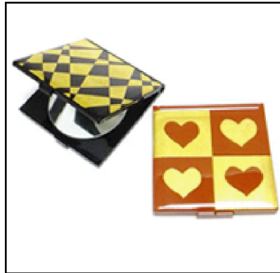
コンパクトミラー 7×7×0.7cm 2,500円