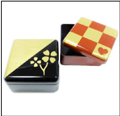
角小箱 樹脂製・ 10.5×10.5×5.5cm 2,600円