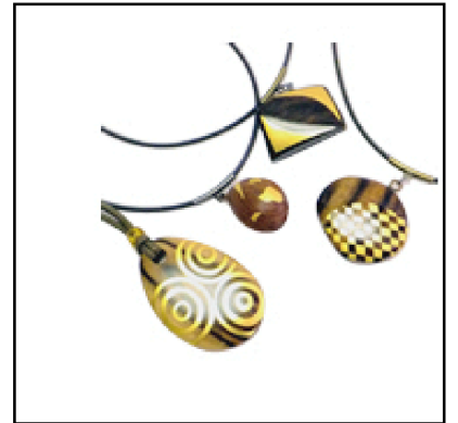
天然木ペンダント (準備中) 4,500円～5,600円