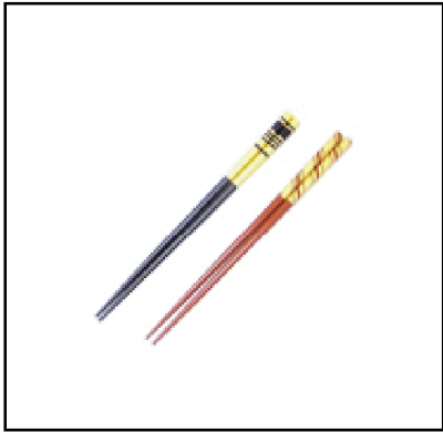
おはし 木製 (各1膳) 長さ22.5cm 1,500円